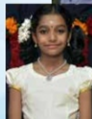
Sketch By BHADRA JAYARAM VYTTILA