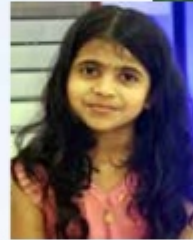
Sketch By SREEPARVATHY S NAIR CHERTHALA