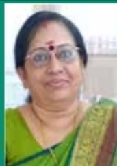
GIRIA K ABM-LIABILITY NORTHPARAVOOR