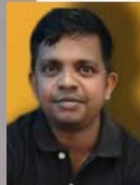
Sketch By AKHIL KJ CREDIT OFFICER THRISSUR