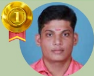
AKHILESH 23 LAKHS