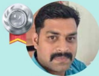
SARITH. K 12.46 LAKHS