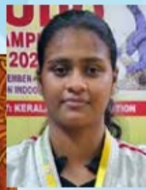
Sketch By RAJASHREE ALUVA