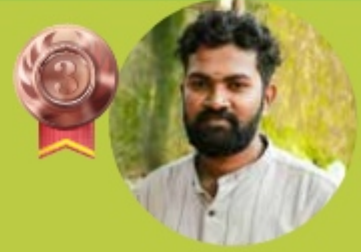
VISHAK K. R 9.42 LAKHS