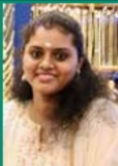
VIMISHNA BC STAFF - THALASSERY