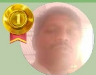
SIJO K J 6.89 LAKHS