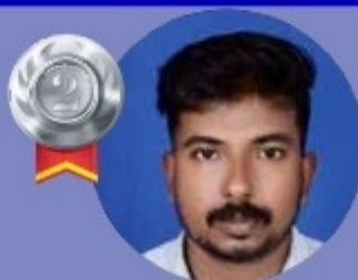
REJITH 5.69 LAKHS