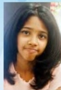
PETALS of Malankara RUGWAITHA NIKHIL NADATHARA