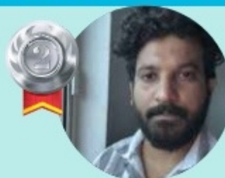
MANESH 4 LAKHS