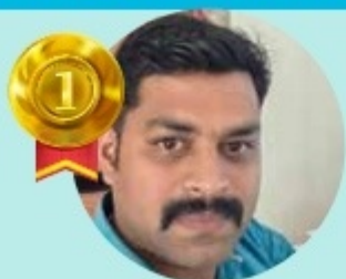
MIDHUNKRISHNA 11 LAKHS