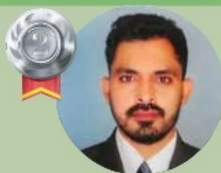
RINU 3 LAKHS