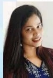
AMRUTHA SENIOR EXECUTIVE TELECALLING

സീനേഹത്തിൻ കപട വർണ്ണങ്ങൾ ചാർത്തി ഒരു സ്വപ്നലോകം തീർത്തു തന്നവൻ അറിയുന്നോ പെൺക്കാടി നിന്നിലെ വേദന ഒരു ജന്മം ഉടനീളം കിട്ടുകയുണ്ടെന്നു നീ ചെല്ലിയതെല്ലാം മറന്നവൻ നീയേ എന്തിനീ (കുരേത ചെങ്കുളം മറന്നവൻ ഒരു ജന്മം പെൺക്കാടി മറന്നുകൊ ഉലഞ്ഞെന്നേരം അവളുടെ മേനിയും മറന്നവൻ അപഹരിച്ചവൻ നീ എന്തിനാ വേണ്ടിയുടച്ചു നീയവളുടെ സ്വപ്നങ്ങൾ തീർത്ത വർണ്ണ ജീവിതം