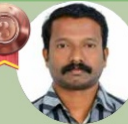
S SUBHASH 3.85 LAKHS