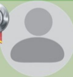
VISHAKH 4 LAKHS