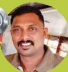
RAKESH V. R 9.79LAKHS