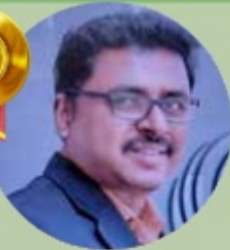
HARI P K 6 LAKHS