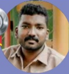
VISHNU S 5.59 LAKHS